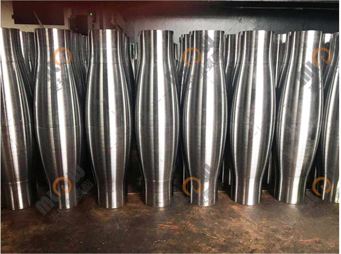
麦克纳姆轮辊轮包胶

15寸重载麦克纳姆轮是重载AGV小车中经常使用的重型麦克纳姆轮，15寸麦克纳姆轮可承载5000KG，承载5吨的重量，375mm毫米直径，在自动化搬运机器人中广泛使用，随着AGV技术的不断发展是其适应各种应用场景，作为其核心设备，智能仓储标配的同时也不断拓宽领域，例如大型设备和产品运输要求越来越严格的情况下，AGV的构造和承载也渐渐发生变化，重载AGV应运而生，在这里，重载麦克纳姆轮也开始起到重大作用。